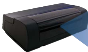
az ESPROS borítása